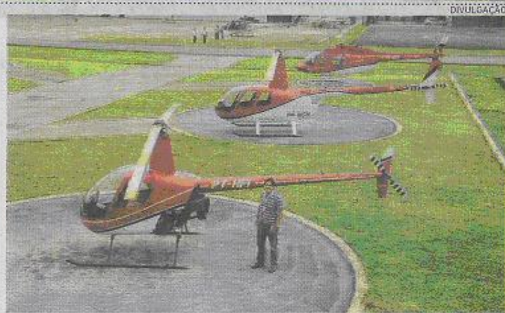
Jorge Bitar Neto, dono de empresa de táxi aéreo: faturamento dobrou

Dados do Ministério do Turismo mostram que o fluxo de estrangeiros ao País também aumentou: foi de 4,3 milhões no período de janeiro a agosto de 2009 para 5,1 milhões em igual intervalo de 2010.