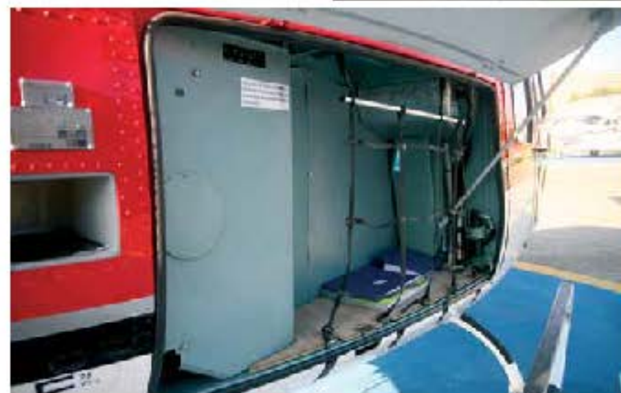
Praticidade o Esquilo tem de monte, boa área de bagageiros por exemplo o torna um utilitário bem versátil.

de um ano também virou marco porque faz um bom tempo que nenhum táxi aéreo no país encomendava um helicóptero novo desse modelo. Segundo Bittar é mais por falta de iniciativa da concorrência pois na sua empresa que completou 12 anos em 2010 e opera com outros cinco Esquilo mais antigos (2 Esquilo B, 2 Esquilo BA e 1 Esquilo B2), e que até agosto do ano passado nunca havia operado com uma aeronave totalmente nova, o plano era de passar para uma segunda fase visando o futuro da empresa, onde a modernização da frota significasse mais do que um fator de venda do seu serviço. Nas anotações de caderneta, o Esquilo B2 recém adquirido comparado com o outro ano 2000 que faz parte da sua frota, é cerca de 5% mais econômico no consumo direto de combustível, algo como R$ 50,00 por hora voada. Da mesma forma que a melhor marca de carro é o Zero km, um Esquilo novo vai ser uma aeronave que vai consumir menos óleo, dar menos trabalho e carrega o item garantia