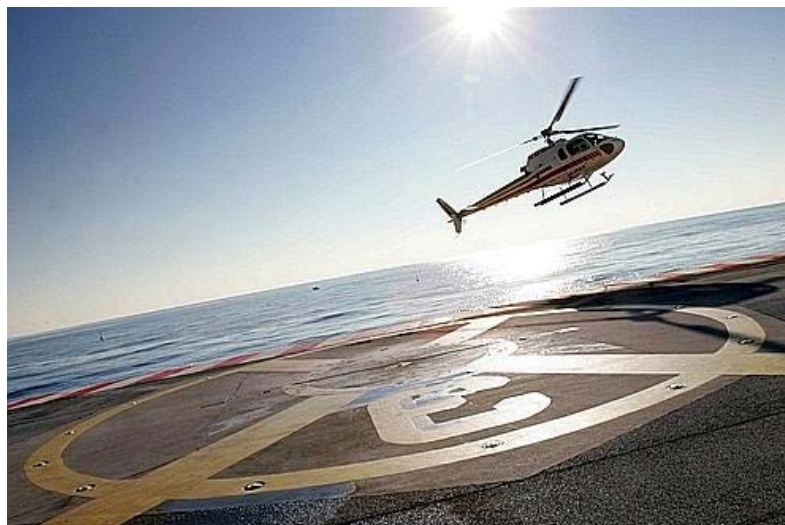
Un hélicoptère civil, qui décolle de l'héliport de Nice.

Publié le 16/08/2011 à 09:18 Réactions (38)