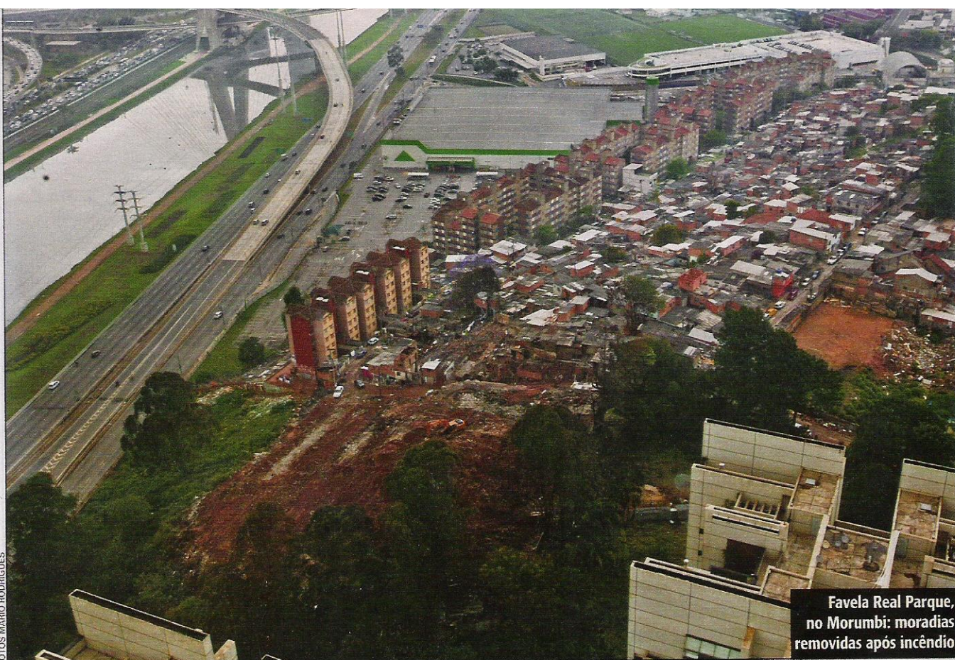
Favela Real Parque, no Morumbi: moradias removidas após incêndio